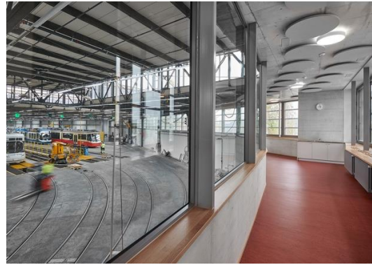
Bilder 5 und 6 – Vor der energetischen Sanierung war die Gebäudehülle der Halle ungedämmt und sorgte für starke Temperaturschwankungen im Innern. Die denkmalgeschützten originalen Fenster im Dienstgebäude wurden mit Janisol HI Vorsatzfenstern ergänzt bzw. zur Halle mit Janisol HI Fenster aus Stahl gedämmt. In den Janisol HI Fenstern verbinden sich filigrane Rahmenprofile mit der innovativen Technologie für höchste thermische Trennung inkl. Dreifachisolierglas.