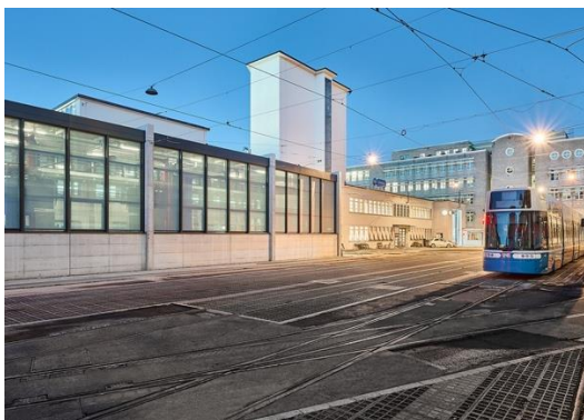
Bild 3 – Die ursprüngliche Aussenwaschanlage wurde neu eingehaust. Die Glasfassade mit dem Aluminium-Fenstersystem Schüco AWS 65 nimmt die rhythmische Gliederung der Oberlichter der Halle auf. Mit der Einhausung können neu alle heutigen und zukünftigen Tramfahrzeuge unabhängig vom Aussenklima gereinigt

Bild 2 – Die ursprüngliche Aussenwaschanlage wurde neu eingehaust. Die Glasfassade mit dem Aluminium-Fenstersystem Schüco AWS 65 nimmt die rhythmische Gliederung der Oberlichter der Halle auf. Mit der Einhausung können neu alle heutigen und zukünftigen Tramfahrzeuge unabhängig vom Aussenklima gereinigt werden.