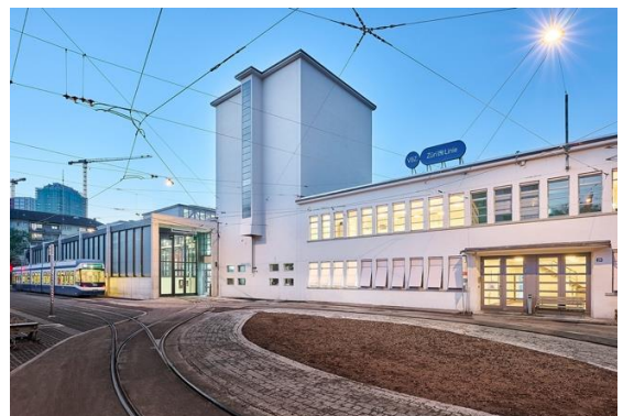
Bild 4 – 2020–22 wurde das denkmalgeschützte Tramdepot in Zürich Oerlikon (1932–35) vom damaligen Stadtbaumeister Hermann Herter energetisch ertüchtigt und betrieblich optimiert. Für die Dämmung von Halle kamen Janisol HI Fenster aus Stahl mit Dreifachisoliertglas zur Anwendung. Beim Dienstgebäude (Gebäudeflügel rechts) wurden die originalen Bauteile wiederverwendet und mit Janisol HI Vorsatzfenstern ergänzt.

Bild 3 – Die ursprüngliche Aussenwaschanlage wurde neu eingehaust. Die Glasfassade mit dem Aluminium-Fenstersystem Schüco AWS 65 nimmt die rhythmische Gliederung der Oberlichter der Halle auf. Mit der Einhausung können neu alle heutigen und zukünftigen Tramfahrzeuge unabhängig vom Aussenklima gereinigt