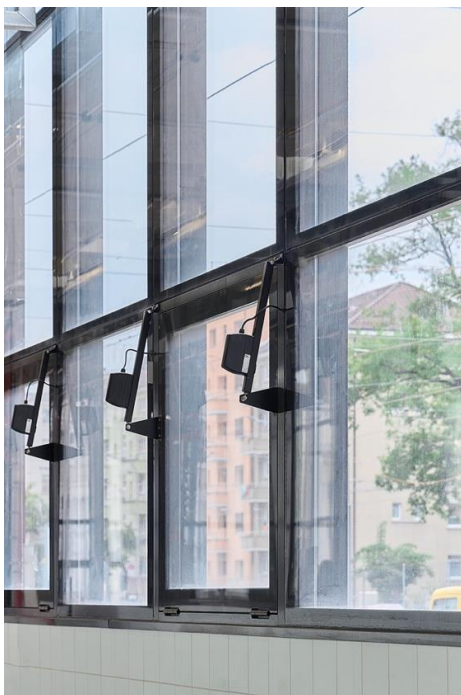
Bilder 7 bis 10 – Da die bestehende, offene Aussenwaschanlage die betrieblichen Anforderungen nicht mehr erfüllte, wurde eine eingehauste Waschanlage gebaut. Hier kommt das Aluminium-Fenstersystem Schüco AWS 65 zur Anwendung. Mit der Einhausung können alle heutigen und zukünftigen Tramfahrzeuge vollständig und witterungsunabhängig gereinigt werden. Gleichzeitig wird die Lärmemission zum Wohnquartier reduziert.