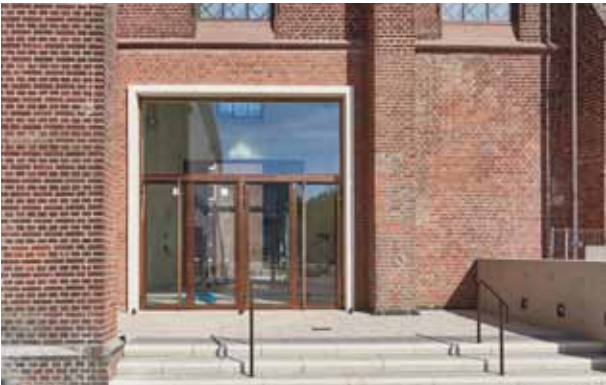
pic_04: Die zweiflügelige Eingangstüre zum Foyer wurde vom Metallbauunternehmen aus dem wärmedämmenden Stahlssystem Janisol gefertigt und mit vorpatiniertem Kupferblech beplankt.