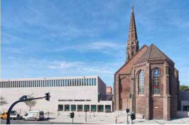
pic_02: Die beiden Neubauten orientieren sich an der Länge des Kirchenschiffs und sind mit dem sorgfältig restaurierten Kirchenbau innenräumlich verzahnt.