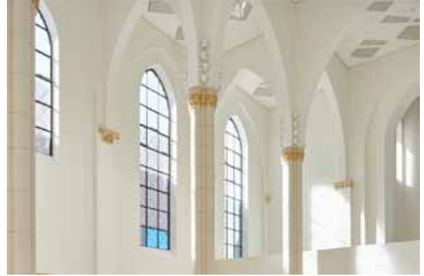
pic_03: Die ca. 9 m hohen Spitzbogenfenster aus dem Stahlprossensystem Janisol Arte bestehen aus drei Segmenten zu jeweils neun Scheiben, die vor Ort miteinander verschraubt und verglast wurden.