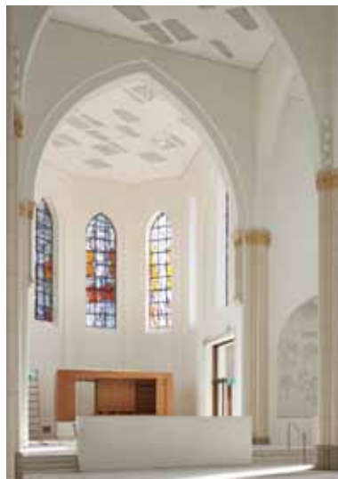
pic_07: Die Rahmen der Spitzbogenfenster wurden bei Jansen/Oberriet gebogen. Als Service für Metallbauer biegt der Hersteller Profile nach Radius oder nach Schablone.