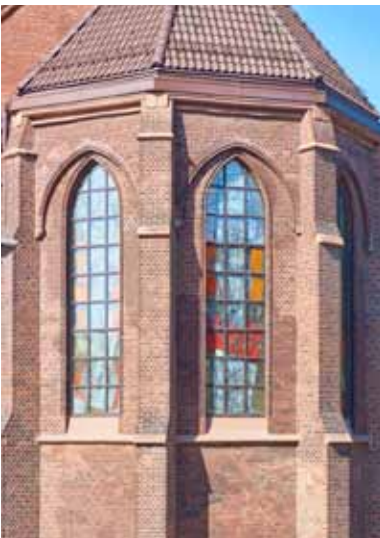
pic_06: Eine Isolierverglasung aus Janisol Arte schützt die historische Bleiverglasung nach außen. Die Buntglasscheiben aus der Glasmalerei Derix wurden mit Janisol Arte neu gefasst.