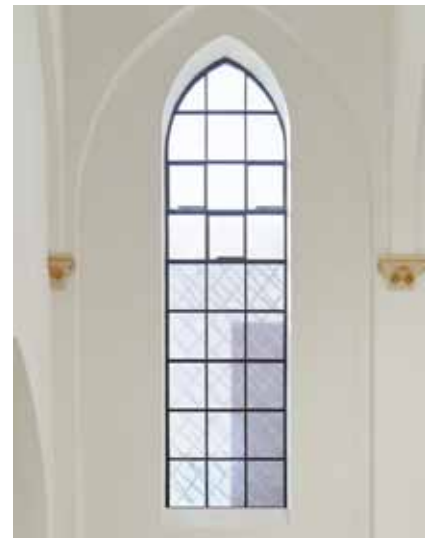
pic_08: Eine auf die Isolierglasscheiben aufgebraachte Folie weckt die Anmutung historischen Glases. Die drei öffbaren Klappflügel werden von kleinen Kettenmotoren bewegt.