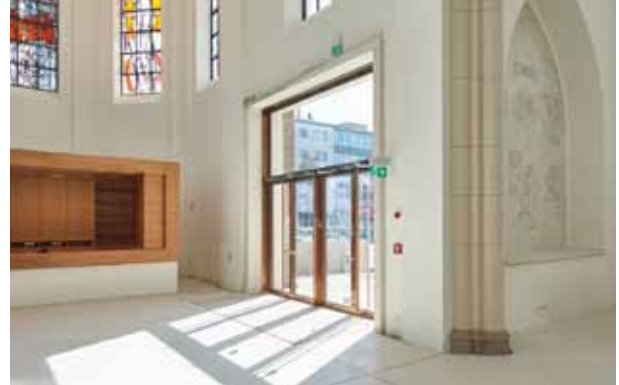
pic_05: Das grosse Foyer dient gleichzeitig als „Open Space“, beispielsweise für Lesungen, kleinere Konzerte und Empfänge.