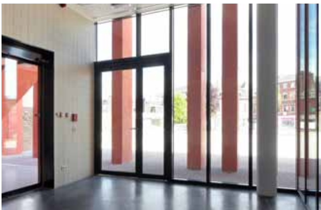
pic_06_Herstal.jpg: Der Zugang erfolgt über zwei 230 cm hohe, vollverglaste zweiflügelige Türanlagen aus dem Stahlprofilsystem Janisol RC 3.