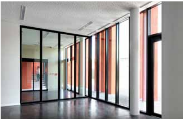
pic_04_Herstal.jpg: Im unteren Bereich ist die Stahl-Glasfassade als 350 cm hohe, einbruchhemmende Festverglasung (RC 2) montiert.