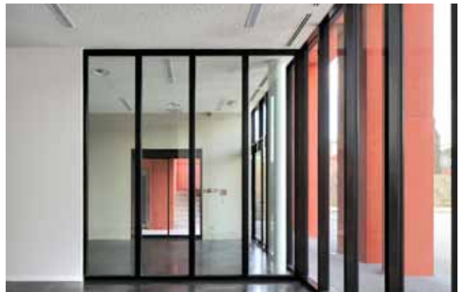
pic_05_Herstal.jpg: Eine festverglaste Trennwand erleichtert die räumliche Orientierung innerhalb des Empfangsgebäudes.