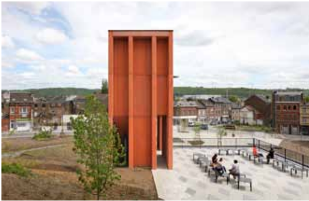
pic_02_Herstal.jpg: Mit einer begehbaren Dachterrasse und einem hoch aufragenden Turm vermittelt das neue Empfangsgebäude zwischen Ober- und Unterstadt.