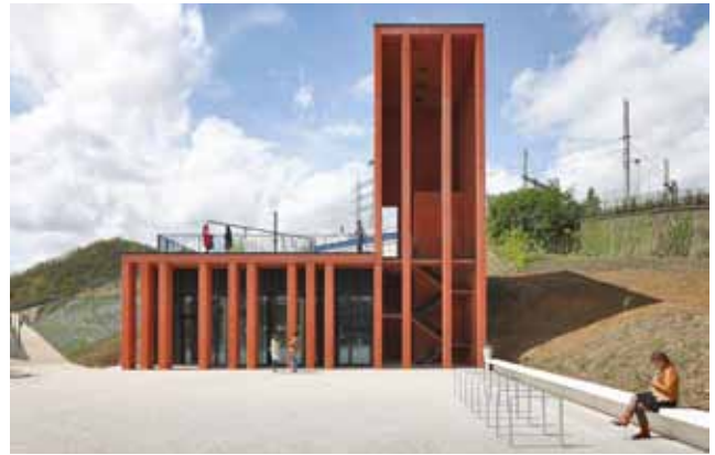
pic_03_Herstal.jpg: Der Turm, der gestalterisch als Landmarke fungiert, beherbergt eine Treppen- und Aufzugsanlage für die vertikale Erschließung.